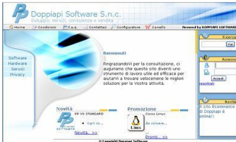
Frontoffice del demo ProCommerce

Doppiapi offre anche un servizio totalmente personalizzabile per l'e-commerce. Il Cliente che sceglie questa modalità di sviluppo può decidere da zero la struttura del sito e personalizzare totalmente l'aspetto grafico e i contenuti. Questa soluzione prevede l'uso di un CoreEngine proprietario e sviluppato da Doppiapi Software in ASP.NET;