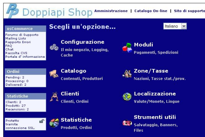
Backoffice del demo LiteCommerce

L'immagine successiva mette in evidenza parte delle possibili operazioni di amministrazione/configurazione dello shop on line e, a seguire, è descritto il dettaglio delle attività possibili.